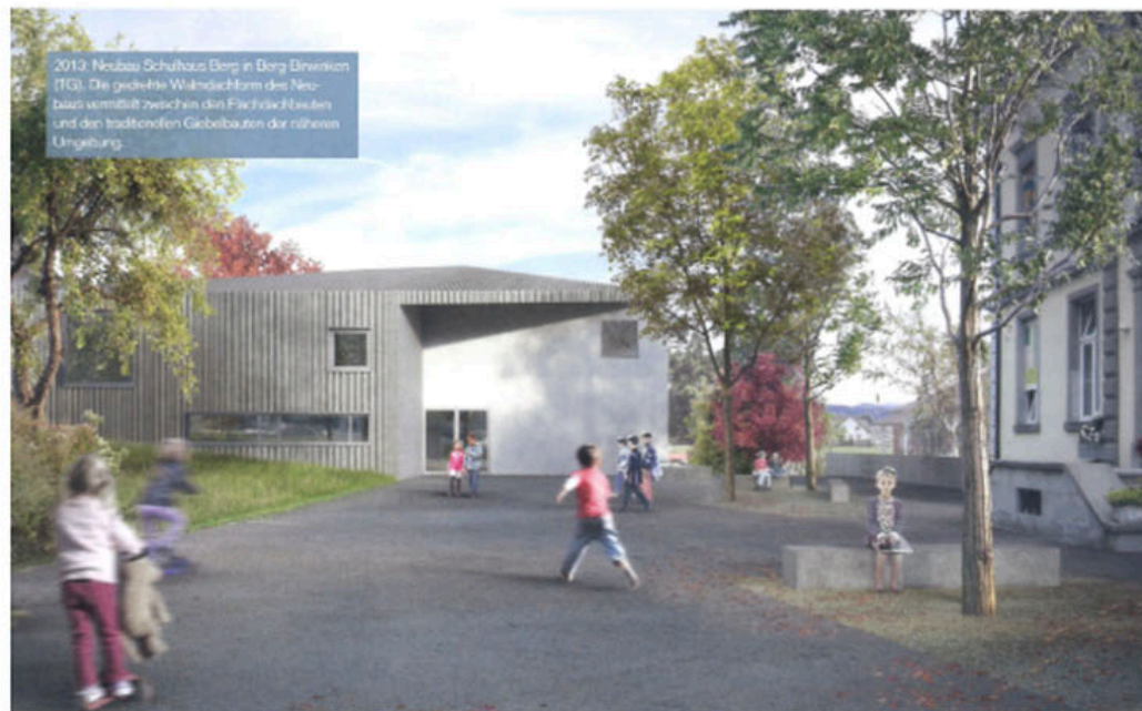
2013: Neubau Schulhaus Berg in Berg Erwinen (IG). Die gedrehte Walmdachform des Neubaus vermittelt zwischen den Flachdachbauten und den traditionellen Giebelbauten der näheren Umgebung.