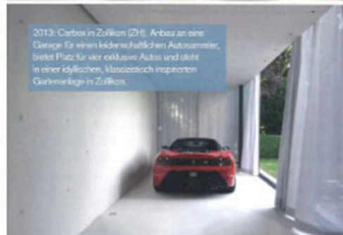
2013: Carbox in Zollikon (ZH). Anbau an eine Garage für einen leidenschaftlichen Autosammler, bietet Platz für vier exklusive Autos und steht in einer idyllischen, klassisch inspirierten Gartenecke in Zollikon.