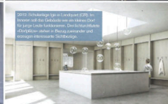
2012: Schulanlage Igis in Lindigriet (IG). Im Innern soll das Gebäude wie ein kleines Dorf für junge Leute funktionieren. Drei lichtdurchflutete «Dorfblöcke» stehen in Bezug zueinander und erzeugen interessante Sichtbezüge.