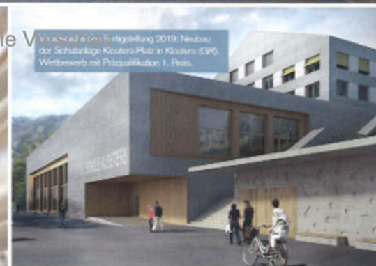
2012/2013: Fertigstellung 2019: Neubau der Schulanlage Klosters-Platz in Klosters (IG). Wettbewerb mit Präqualifikation 1. Preis.