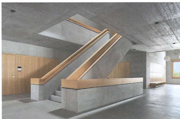
Überhohe Bereiche erweitern die Treppenhalle: Das viele Holz ist schön, der Beton währschaft.