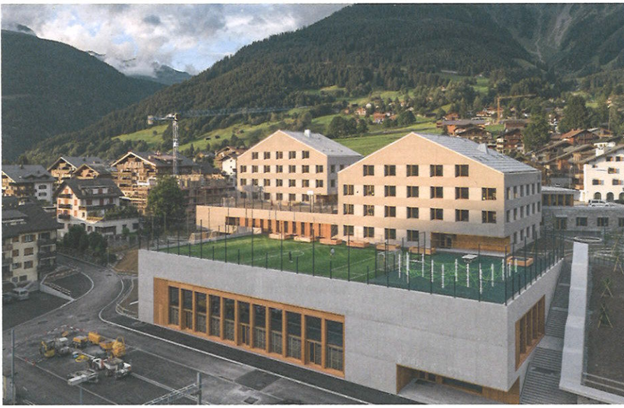
Anders und doch gleich: die ins Gelände gebaute Schulanlage inmitten der Klosterser Jumbo-Chalets.